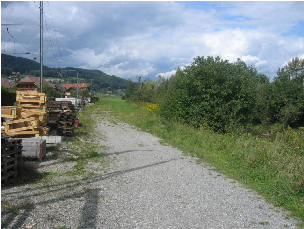
Foto 11: Linkes Gürbeufer unterhalb Bahnhofbrücke Toffen Km 8.750 dieser Landstreifen wird für die Gerinneaufweitung Toffen bis Talguet verwendet