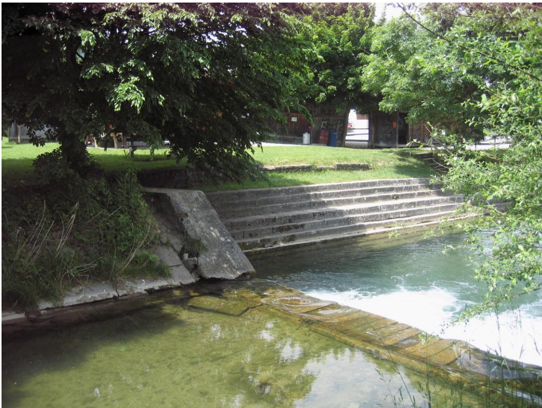
Foto 4: Gürbebad Mühlethurnen, Km 14.200 die Sperre wird um 30 cm abgesenkt, was die Durchgängigkeit für Fische und den Abfluss verbessert