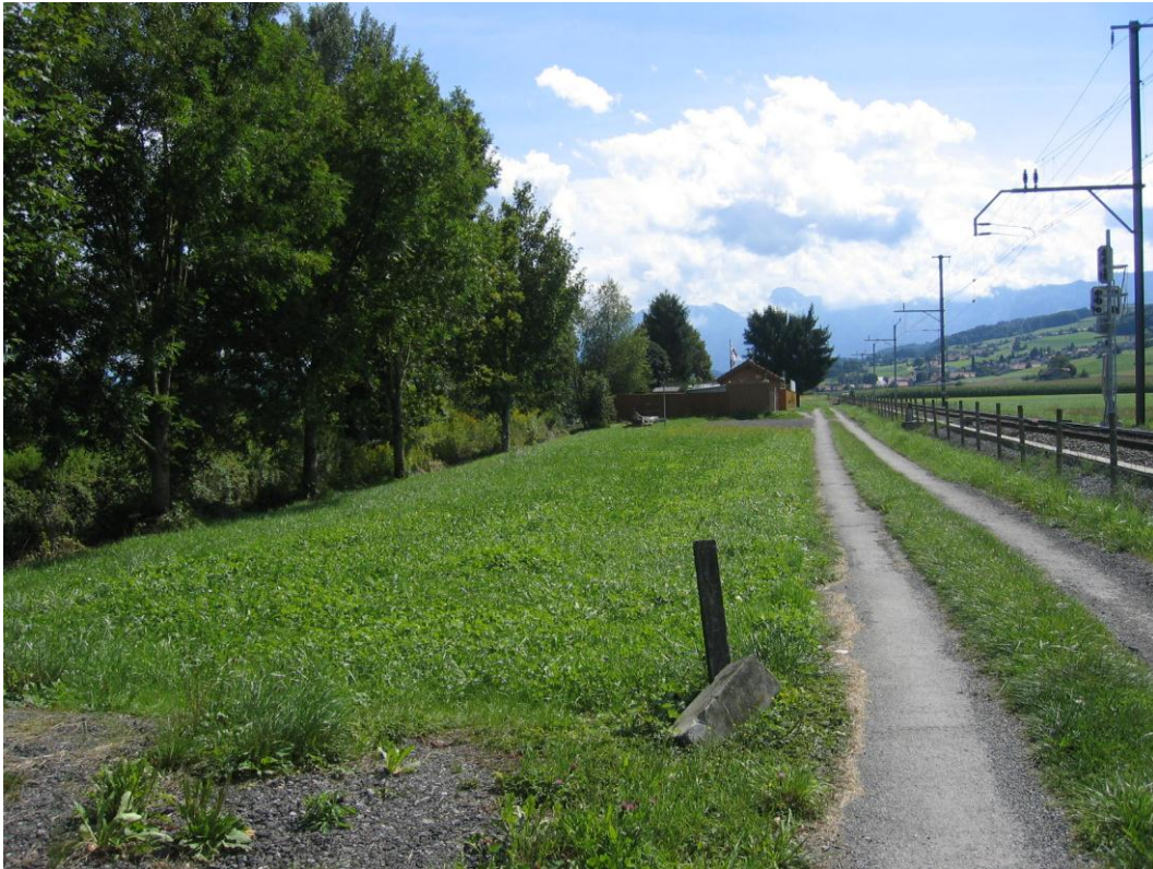
Foto 5: Linkes Gürbeufer in Toffen Km 9.350, Blick flussaufwärts Projektierter Flachuferbereich nördlich des Hornusserplatzes