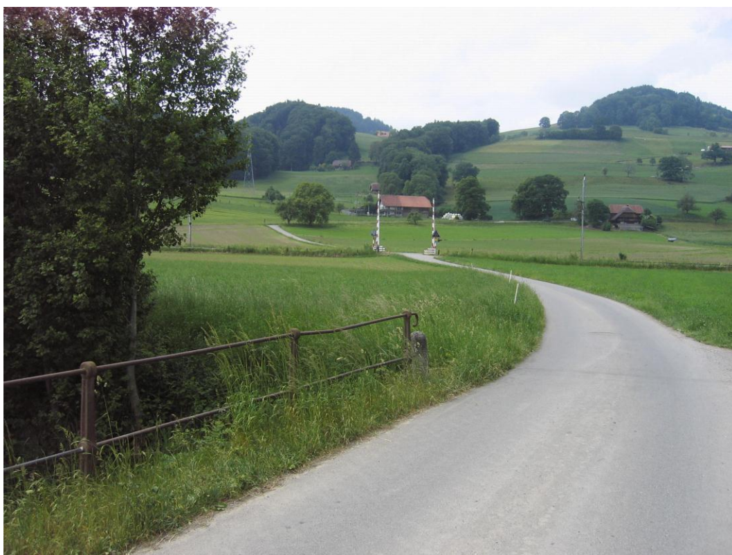
Foto 2: Schürmatt Km 15.000 die Wiese links des Flurweges wird aufgeschüttet