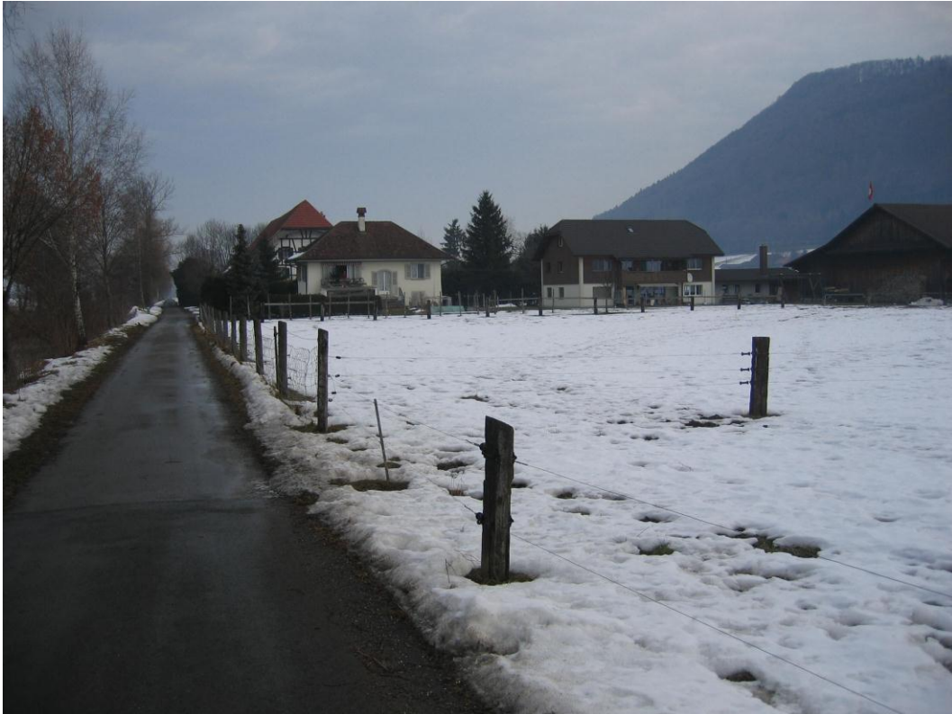
Foto 12: Talguet Km 7.650, links im Bild das Gürbeufer, Blick flussabwärts